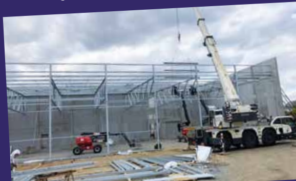
OVOTEAM PLAINTEL - CECIA