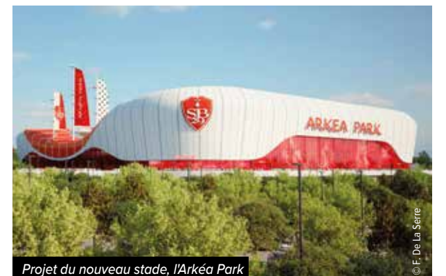
Projet du nouveau stade, l'Arkéa Park