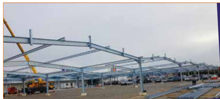
LECLERC PLOUDALMEZEAU - INSTALLATION PHOTOVOLTAÏQUE - TRACE &amp; ASSOCIÉS

JOURNAL ÉDITÉ PAR LE STADE BRESTOIS 29 / SIÈGE SOCIAL : CENTRE DE L'ARMORICAINE - 6, CHEMIN DE PEN HELEN - 29200 BREST / TÉL. 02 98 02 20 30 - DIRECTION DE LA PUBLICATION : FLORENT CORRE / PASCAL ROBERT RÉDACTION FLORENT CORRE / VALENTIN BLOCH / NATHANAEL GILLET - MAQUETTE : STEVEN LE BIHAN / THIBAUT FLOCH - SERVICE COMMERCIAL : GUILLAUME GÉLÉBART 06 71 64 75 70 JEAN-LUC LE MAGUERESSE 07 65 22 84 29 - JEAN-PHILIPPE LE ROUX 06 75 05 12 57 - MATTHIEU FLOCH 06 15 47 16 86 - KÉVIN JAOUEN 07 60 83 01 80 - ENZO HENRY 06 01 45 13 98 COORDINATION : VIAMEDIA - JOURNAL IMPRIMÉ À 140 000 EX - PHOTOS NON CONTRACTUELLES. NE PAS JETER SUR LA VOIE PUBLIQUE.