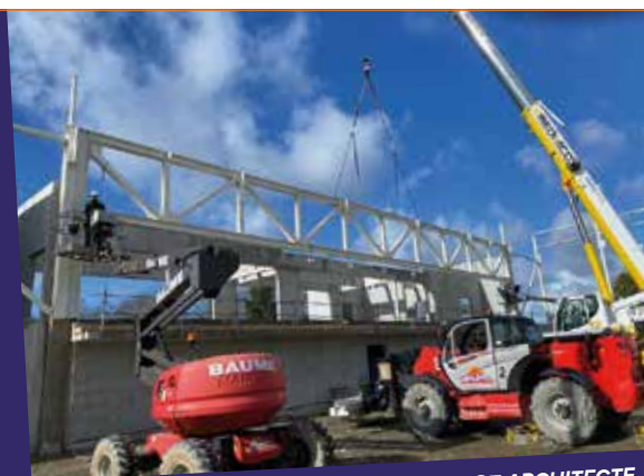
SALLE DE SPORT PLEUVEN - MICHOT ARCHITECTE