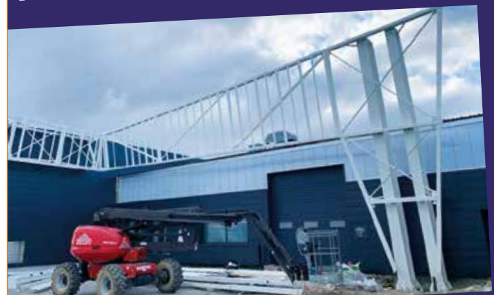
BERVAS - KERSAINT PLABENNEC - COBI