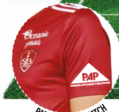
PARTENAIRE DU MATCH